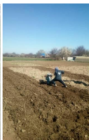
Подготовительная группа с лёгкостью помогает родителям по хозяйству !