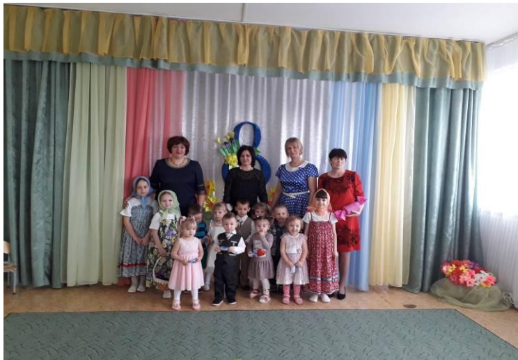
малыши празднуют 8 марта.

В нашем детском саду всегда проводится праздник, посвященный этому прекрасному дню, на который мы приглашаем мамочек и бабушек, чтобы они вместе со своими детьми повеселились, поучаствовали в конкурсах и просто посмотрели на своих любимых красивых деток.