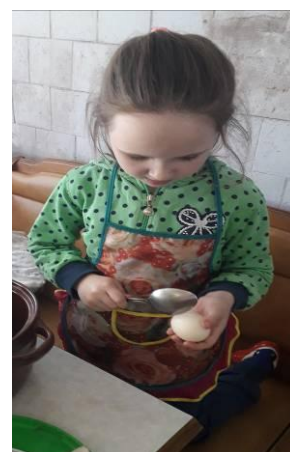
Кто – то нашёл себя в кулинарии.